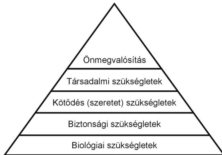
A maslowi hierarchiapiramis

A „magasabb szint szükségletének tilalma” tehát azt jelenti, hogy addig, amíg a biológiai szükségletek kielégítésén fáradozik az egyén, addig nem tud az önmegvalósítás problematikájával foglalkozni, mert az életben maradás köti le az energiáit. Magyarán, ha nagyon éhes vagyok (1. szint), megeszem a szomszédom kiflijét is, függetlenül a vele való kapcsolati igénytől (3. szint), illetve amíg a létbiztonságom nem garantált (2. szint), addig a társadalmi elismertség (4. szint) iránti igények nem jelentkeznek.